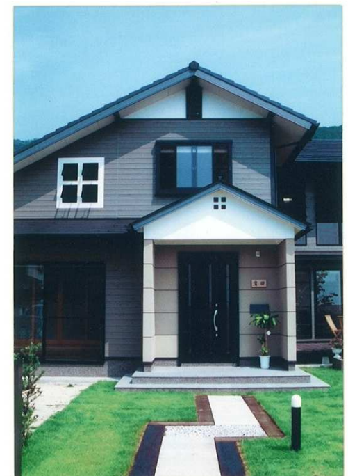
外観(玄関・アプローチ)