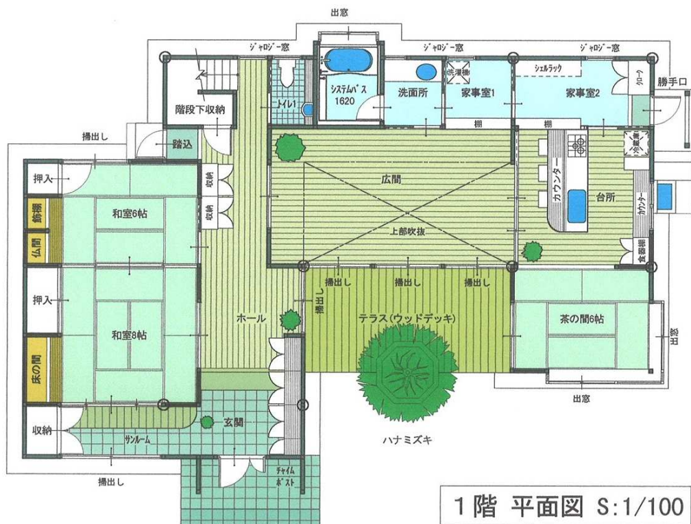
1階 平面図 S:1/100