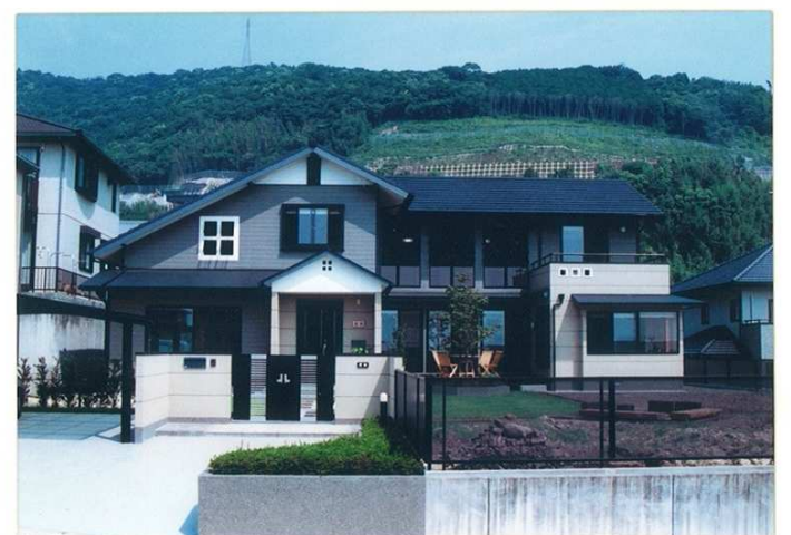
外観全景(南側より)