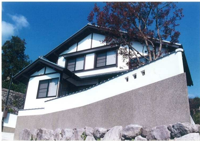
南側外観を見上げる。別府湾からの太陽の光をいっぱい浴びて、しっくい壁が白く輝く。