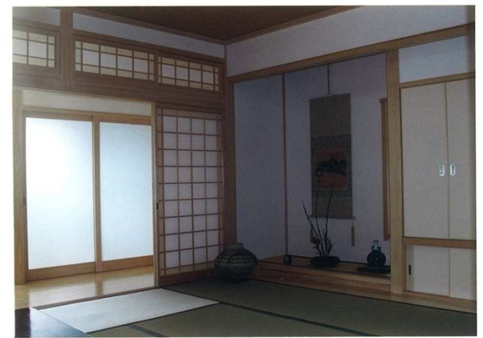
明るい座敷と光を浴びる広縁を仕切るモダンな障子には、月桃紙を採用。やわらかい光が座敷に差し込んでくる。