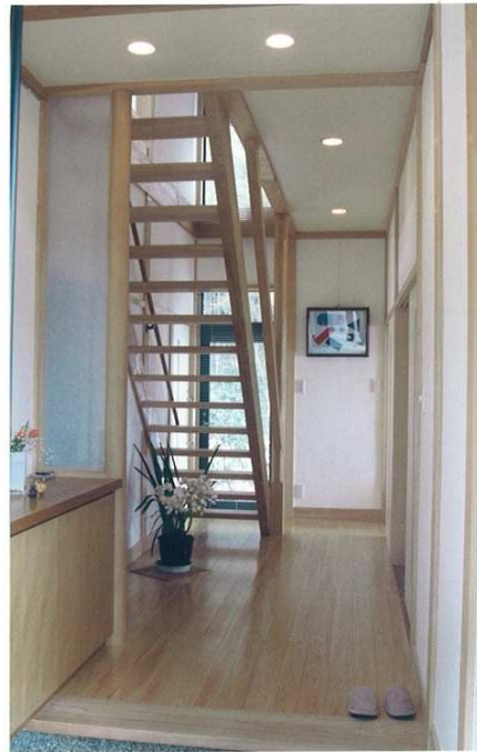
スリット状の階段で、一体となった玄関ホール。明るい桧板としっくい壁が、気持ちいい。