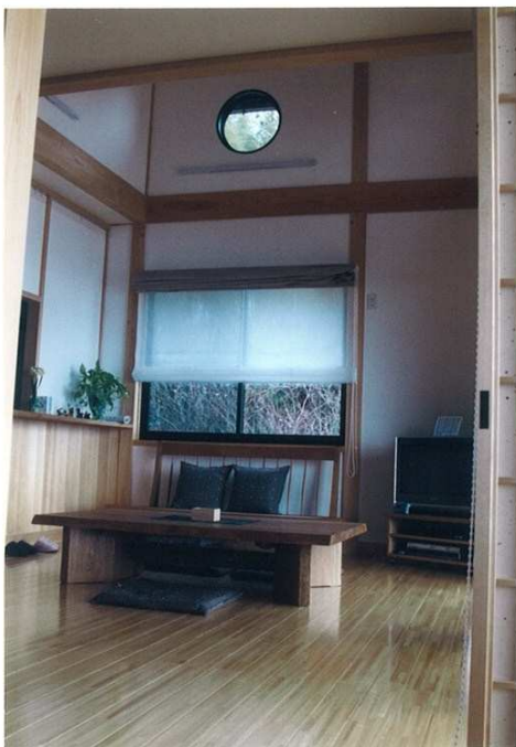
広縁より吹抜のある居間を見る。木としっくい壁が、家族みんなのくつろぐ空間を作る。柱はすべて4寸角の桧。

床：桧板貼り（熊本産・大工さん） 壁：しっくい塗り（左官さん） 天井：月桃紙貼り（沖縄産・内装屋さん）